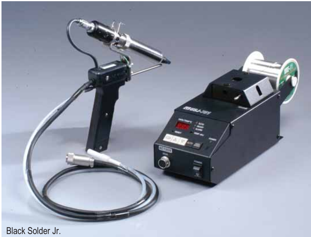
Black Solder Jr.

First in the world. 150W and 300W High power soldering irons with automatic solder feeder. Best suited for huge thermal volume soldering application.